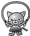
なわとびカード 小牧市立光ヶ丘小学校

3 学期の体育では、縄跳びに挑戦します。 縄跳びカードに書いてある回数目指して頑張ります。 たくさん跳べるように励ましてあげてください。