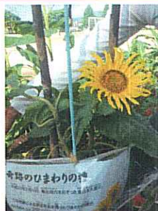
阿蘇市立内牧小学校さんから