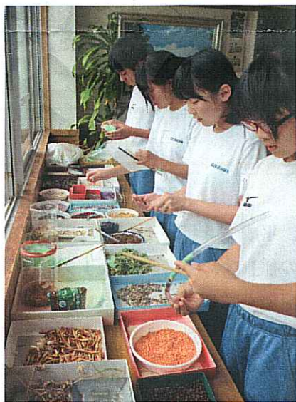
一生懸命タオルハンガーを作成中